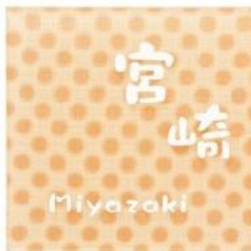
3D-1-523(白) キャンディーオレンジ 漢字・ローマ字:クラフト体