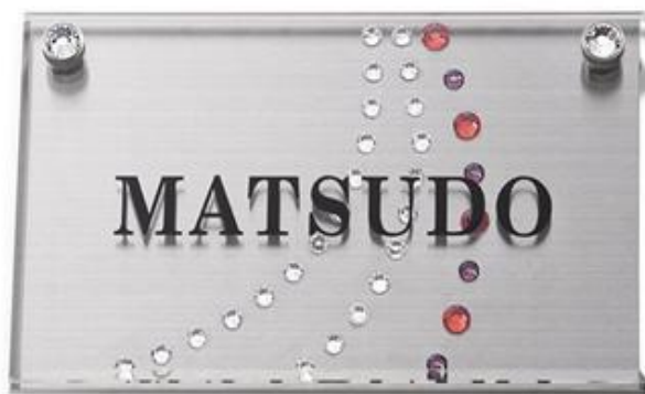
CMM-S-1 ステンレスヘアライン ローマ字:明朝体 文字黒