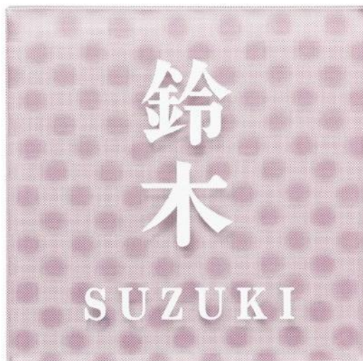
3D-4-521(白) ストロベリー 漢字・ローマ字:明朝体