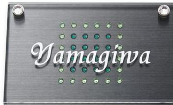
CMM-K-3 ブラックステンレス ローマ字:ティランティ体 文字白